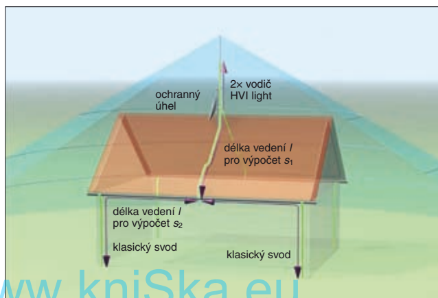
Obr. 1. Hromosvod realizovaný kombinací svodu HVI light a neizolovaných drátů – symetrické rozložení

Proudový můstek se rozvází a jednotlivými cestami nepotečou stejně velké proudy.