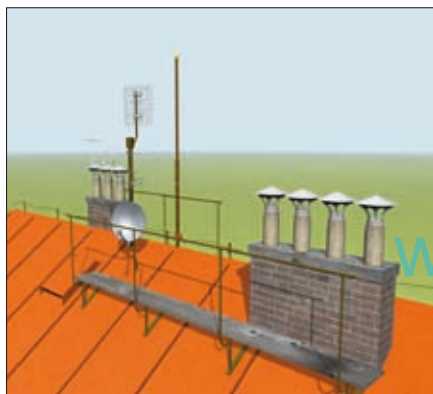
Obr. 8. Detail chaosu na střeše

bude dosti vysoko na to, aby na stožár GFK někdo něco montoval.