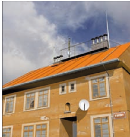
Obr. 9. Izolovaný hromosvod se dvěma jímáči a čtyřmi izolovanými svody s využitím vodiče HVI light

Prozatím probírané varianty využití vodiče HVI light byly určeny pro nevodivé střechy. Ukázali jsme si ale, že v případě zavedení vodiče až k uzemnění je možné toto řešení použít i pro plechovou krytinu, celá se ale musí nacházet v ochranném prostoru jímáče. A prá-