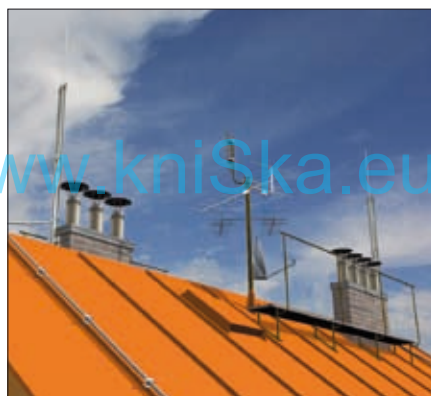
Obr. 10. Všechny aplikace na střeše, jakož i střecha samotná se nacházejí v ochranném prostoru hromosvodu

ce dvojice jímáčů na stožárech GFK. Tyto svým ochranným úhlem spolehlivě pokryjí celou střechu a dům. Jako svody jsou využity vodiče HVI light, vždy dva od každého jímáče. Je to situace velmi podobná čtvrté variantě, ovšem s tím rozdílem, že svody vedou nepřerušeno až k zemi. V tom případě nemůžeme použít výpočet s pro čtvrtou variantu, ale naopak velmi jednoduchý výpočet – za k_c se dosadí 0,5 a za l celková délka jednoho svodu. Po výpočtu lze zjistit, že délka vedení může být až 22 m (čili opět řešení i pro větší domy).