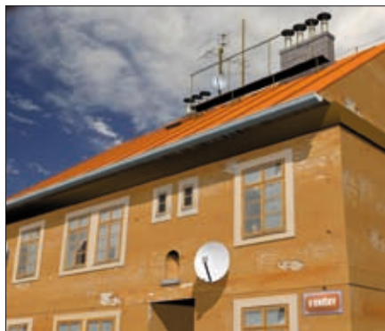
Obr. 7. Objekt s plechovou střechou a nedostatečně chráněnými anténami a vnitřní instalací

vě v této vlastnosti spočívá další z velkých výhod tohoto řešení. Podívejme se třeba na situaci znázorněnou na obr. 7 a obr. 8, kde je střecha plechová, hustě pokrytá anténami, komíny a lávkami – o uložení koaxiálních kabelů ani nemluvě. Donedávna neexistovalo pro takovýto případ akceptovatelné technické řešení oddáleného hromosvodu. Vše vyřeší instala-