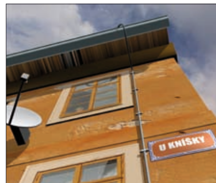
Obr. 11. Izolovaný svod HVI light lze vést i v bezprostřední blízkosti míst s výskytem osob

ostatní antény a jiná zařízení v tomto pásmu jsou tedy chráněny před úderem blesku a není třeba se jim příliš věnovat. Platí ovšem pravidlo připojení těchto zařízení na ekvipotenciální pospojování. Svody je potom možné klasicky přichytit např. k záhybům plechové krytiny a dále pokračovat na podpěrách až k uzemnění (obr. 9, obr. 10 a obr. 11). (Komu by kazilo estetický dojem uložení poměrně silných vodičů na zdi, může svody skrýt pod fasádu – více o tzv. skrytých svodech v kap. 10 Knišky 2.0.)