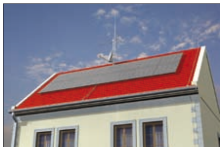
Obr. 3. Izolovaný hromosvod – klasický chráněný štít s izolovaným svodem od vykryvacího jímáče

Varianta podle obr. 2 není samozřejmě možná pro objekty s plechovou či jinak vodivou střechou. Dalším podstatným omezením je jedna jímací tyč pro celý objekt, takže ochranný úhel tvořený tímto jímáčem nemusí vždy pokrýt celý domek. Ovšem zde se nabízí řešení uvedené na obr. 3. Rohy střechy domku jsou „vykryté“ pomocnými jímáči z drátu (asi 0,3 m), rozvedenými na obě strany střechy a připojenými ke svodům. Tímto opatřením se podstatně zvýší schopnost jímací soustavy zachytit blesk. Ovšem pozor, tato vedení na krajích střechy vytvoří izolovaný hromosvod, takže např. fotovoltaické panely na střeše se nesmí k těmto svodům