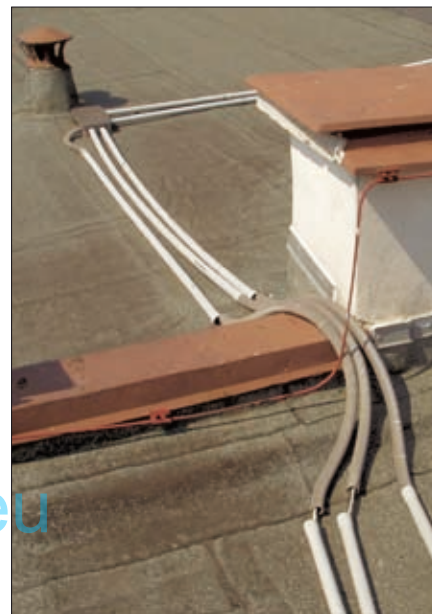
Obr. 6. Montážní chyba – ohrožení vnitřní instalace bleskovým proudem

Další možnou variantou je např. umístění jímáče DEHNcon H zcela na krajích střechy a vedení vodiče HVI light svisle po bočních stěnách domku až k uzemnění.