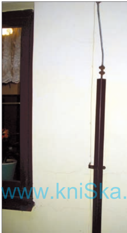
Obr. 5. Montážní chyba – ohrožení vnitřní instalace bleskovým proudem

Výsledek tedy s přesahem splňuje požadavek na maximální hodnotu s pro vodiče HVI light, tj. 0,45 m.