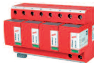
DEHNventil M TNS

Kombinovaný svodič bleskových proudů DEHNventil je nekompromisní svodič přepětí SPD typ 1, jehož srdcem je dvojnásobné jiskřiště. Tento svodič bleskových proudů se nasazuje co nejbližší vstupu napájecích vodičů do objektu. V podmínkách České republiky je nejčastěji použit DEHNventil M TNC, avšak třeba na území jižní Moravy, díky rozdělení na TN-S již v místě elektroměrového sloupku je třeba v hlavním rozváděči nasadit DEHNventil M TNS. Schematické zapojení ukazuje obr. 1. Hlavní výhodou kompaktního svodiče bleskových proudů DEHNventil je jeho velmi nízká ochranná úroveň U_p \leq 5 kV při jeho zatížitelnosti bleskovými proudy odpovídajícími třídě ochrany před bleskem LPL I. Pokud je vzdá-