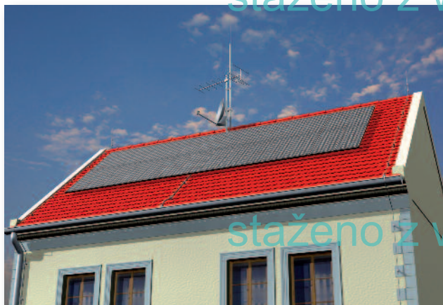
Fotovoltaický článek na střeše rodinného domu.

Při takovéto aplikaci začneme postupovat od paty objektu. I ten, kdo přes analýzu rizika dle ČSN EN 62305-2 nevěří na to, že jeho dům může zasáhnout blesk, nepředpokládá, že by se to nemohlo stát nikde v dvoukilometrovém okolí. Takže svodič bleskových proudů na vstupu napájecích vodičů do objektu představuje v současné době standard, na kterém se nešetří. Nezávisle kde se dům nachází, je možné dle typu napájecí sítě nasadit svodič bleskových proudů, který je přizpůsoben typu napájecího systému.