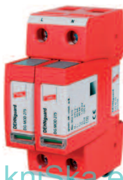
DEHNGuard TN 2P

Nyní, podle počtu panelů nasadíme svodiče přepětí na vstupu do měniče a i tentokrát použijeme svodiče přepětí, které jsou přesně uzpůsobeny svému účelu. Nasazením speciálních