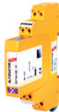
BLITZDUCTOR XT BD

svodičů pro stejnosměrné obvody, které mají své ochranné prvky uzpůsobené na stejnosměrný proud docílíme vysoké bezpečnosti celé instalace, opět bez nutnosti přistupovat na kompromisní řešení.